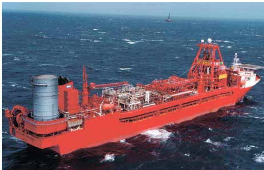
Фото 2. Плавучий комплекс добычи, хранения и отгрузки нефти (FPSO)

платформы зависит от условий эксплуатации (удаленности от берега, глубины моря, климата) и способов разработки месторождения (сетка разбуривания скважин, дебит нефти).