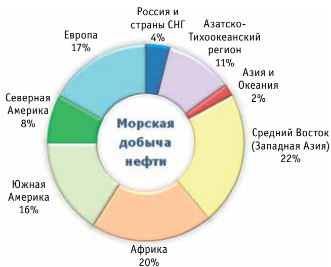
Диаграмма 2. Распределение добычи нефти на континентальном шельфе по регионам мира