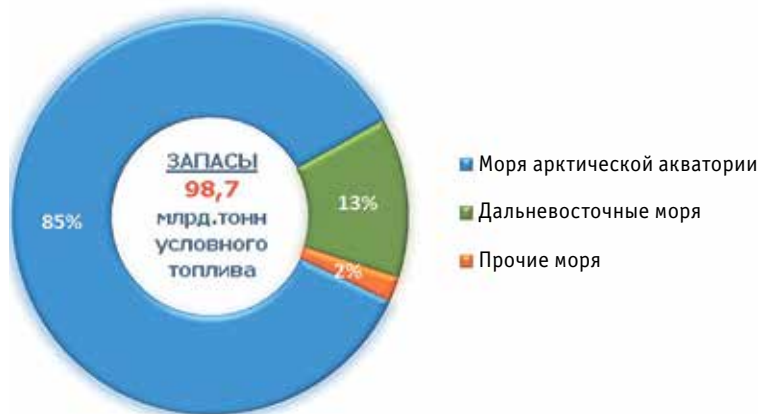
Диаграмма 4. Запасы углеводородов на континентальном шельфе России