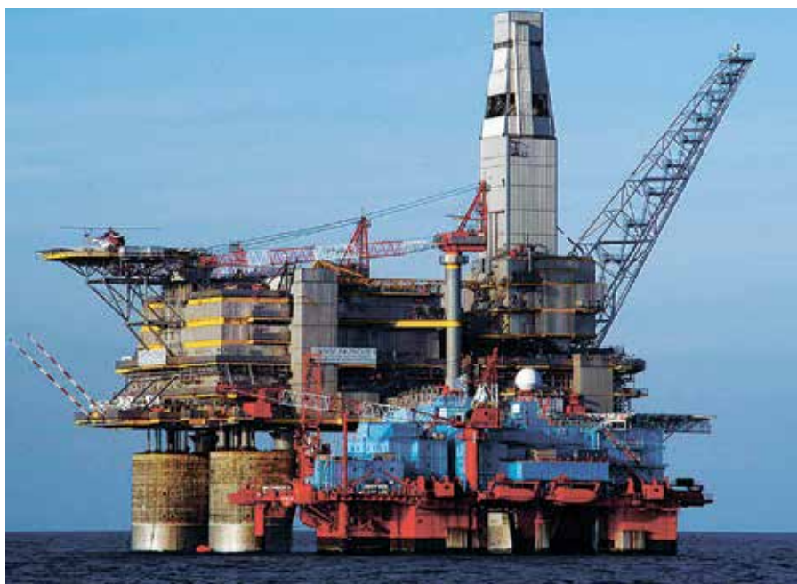
Фото 1. Буровая и добывающая платформа гравитационного типа

Энергетический потенциал развития экономики во многом зависит от морского будущего нефти и газа. На этом настаивают углеводородные эксперты. В нашей стране промышленное освоение континентального шельфа заявлено как перспективное. Однако достижение результата предполагает согласованное решение целого ряда правовых, инвестиционных, геологоразведочных, инфраструктурных и экологических задач.