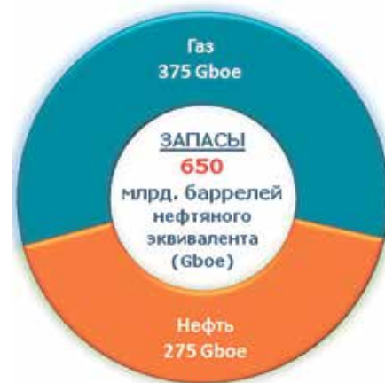
Диаграмма 1. Мировые запасы нефти и газа континентального шельфа

Основные подводные залежи нефти и газа сосредоточены в Персидском заливе (Саудовская Аравия, Катар). Здесь находится более половины мировых