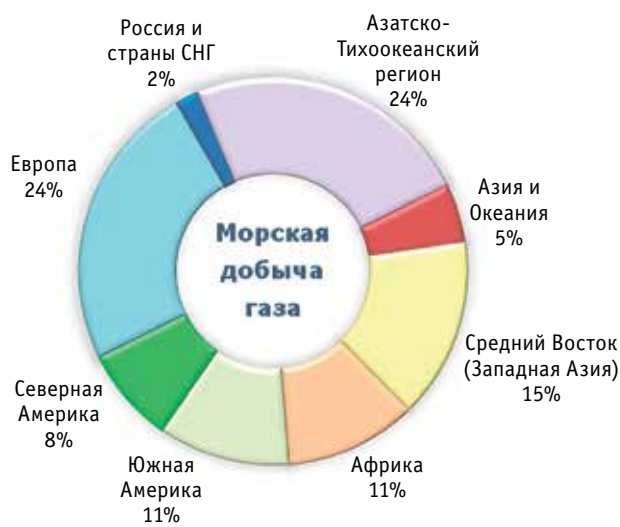
Диаграмма 3. Распределение добычи газа на континентальном шельфе по регионам мира