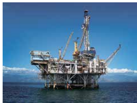
Фото 3-5. Технологические платформы, оснащенные оборудованием подготовки нефти и газа