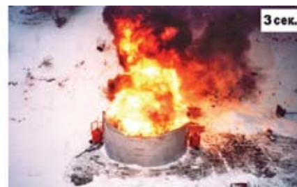
Интенсивное горение резервуара