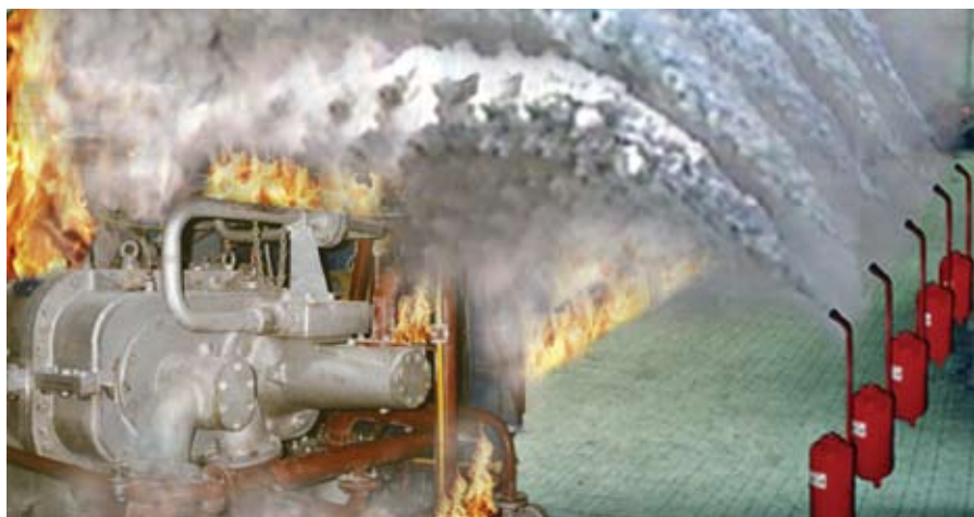
Рис. 5. Принцип действия автоматической системы при тушении пожаров на объектах нефтегазового комплекса

сификации, это резервуар РВС-30000; при некоторой доработке ОПАН-100 возможно тушение РВС-50000. Предварительная оценка стоимости автоматической, автономной системы аэрозольно-порошкового тушения для любого резервуара составляет не более 0,5% от стоимости резервуара, заполненного нефтепродуктами. Учитывая низкую стоимость, высокую надежность, быстрдействие и отсутствие каких-либо регламентных работ