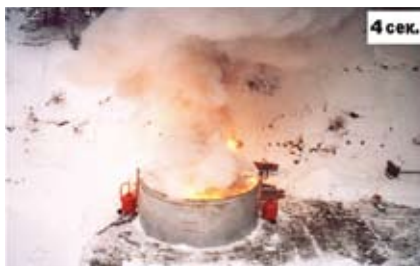
Синхронное автоматическое включение модулей от УСП 101-Э110