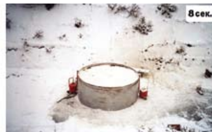
Полное тушение резервуара