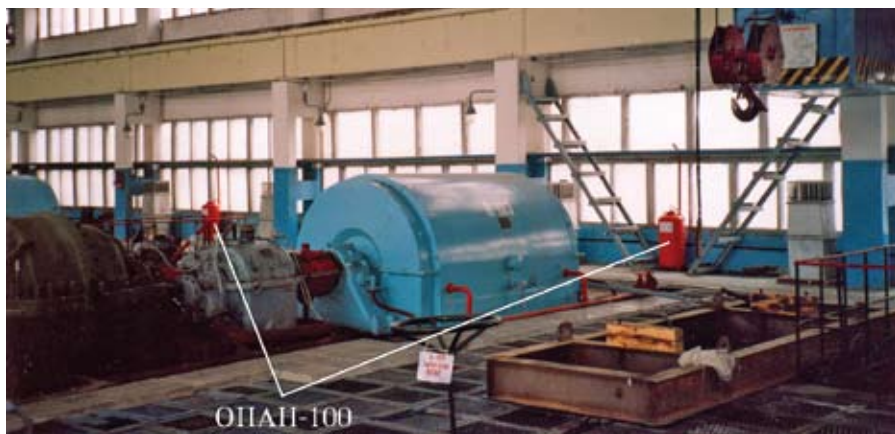
Рис. 4. Автоматическая система противопожарной защиты компрессорного цеха завода «Пермнефтегазпереработка» (г. Пермь)