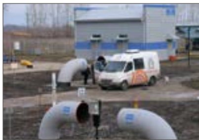
Рис. 2. Оборудованные места загрузки и выгрузки диагностических комплексов для ВТД ТТ КС

Также была проведена совместная работа по паспортизации де-