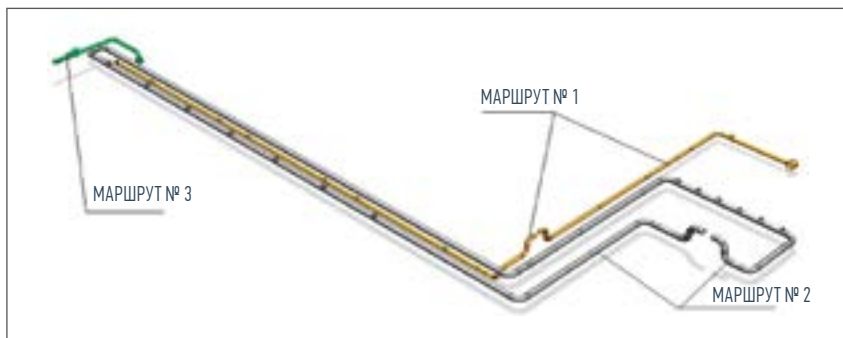
Рис. 4. Маршруты для испытаний диагностических комплексов для ВТД ТТ КС