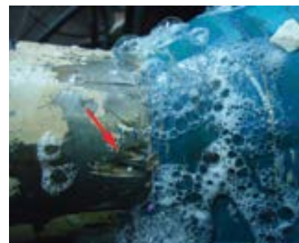
Фото 2. Разрушение внутреннего стеклопластикового вкладыша

стальные патрубки, соответствующие по наружному диаметру и толщине стенки защищаемому от коррозии трубопроводу. Различие состоит в том, как выполнены силовые элементы, выдерживающие большие осевые, радиальные и изгибающие нагрузки, а также в конструкции уплотнительных элементов, от которых зависит их эксплуатационная надежность. Основным недостатком конструкции вставок СИ, SHD и ИММ состо-