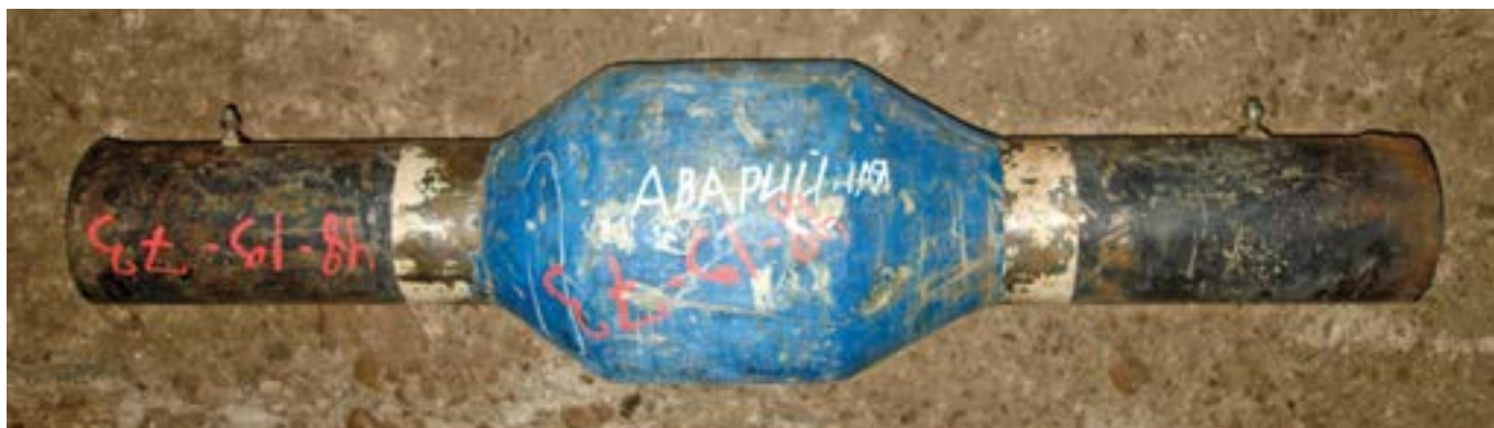
Фото 1. Общий вид вставки ЭВ, вышедшей из строя в процессе эксплуатации

На этой вставке при изгибе произошло разрушение внутреннего стеклопластикового вкладыша, что отчетливо видно на фото 2. Это явилось основной причиной потери герметичности всей уплотнительной системы данной конструкции электроизолирующей вставки, хотя была предусмотрена 3-уровневая