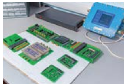
Платы и контроллеры производства ООО «Нефтепромавтоматика»

– Примеров таких не один десяток. Наше ПО используется на объектах «Роснефти», «Транснефти», «Татнефти», «Башнефти», ЛУКОЙЛа, «Газпром нефти», в ряде компаний в Казахстане. В «Транснефти», например, на ЛПДС «Транснефть-Урал» используют нашу