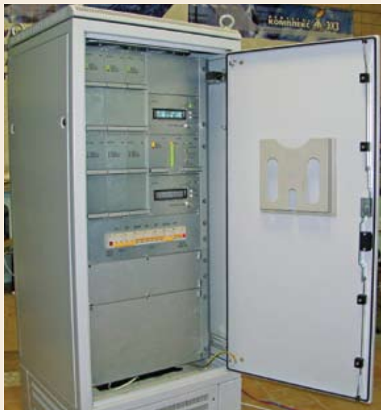
Фото 1. КМО НГК-ИПКЗ-Евро-3,0-(48)-У2

ния напряжения сети и температуры окружающей среды фиксируются в энергонезависимой памяти журнала событий. При обнаружении обрыва цепи контроля потенциала КМО переходит в режим стабилизации тока, при этом задание модифицируется по оригинальному алгоритму. В этом режиме накопление времени защиты сооружения приостанавливается. Встроенный интерфейс RS-485 позволяет осуществлять удаленный мониторинг состояния, архивацию данных, управление режимами работы КМО. При разработке особое внимание уделялось стойкости электронных блоков к воздействию импульсных перенапряжений. В соответствии с зонной концепцией все цепи внешней коммутации имеют барьер грозозащиты. Цепи электропитания и нагрузки имеют класс защиты I в соответствии ГОСТ Р 51992-2002.