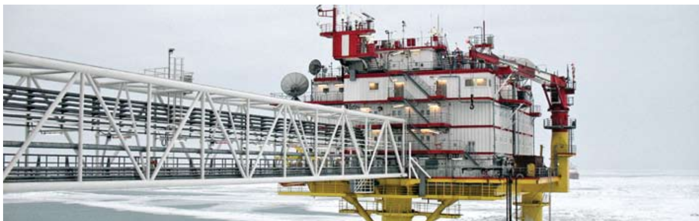
Фото. ЛСП-1 для нефтегазоконденсатного месторождения им. Ю. Корчагина

Отмечая такое знаменательное для ОАО «ЛУКОЙЛ» событие, как 20-летие деятельности, нельзя не упомянуть, что начиная с образования нефтяного концерна «ЛангепасУрайКозалым-Нефть» компания прошла большой путь в своем развитии и по праву вошла в число крупнейших энергокомпаний мира. Будучи ровесником новой России, ОАО «ЛУКОЙЛ» развивалось столь же стремительно, находясь на переднем рубеже прогресса и инноваций.