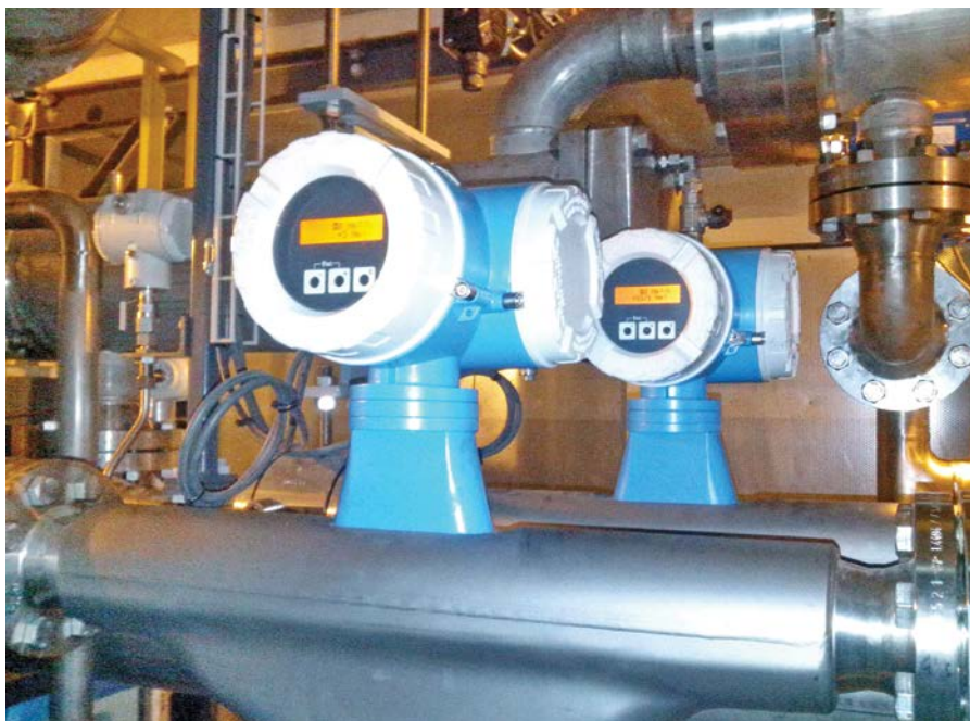
Фото 5. Узел учета компримируемого газа в компрессорных установках

специальной программе, создающей теоретическую модель поведения газа при определенных условиях (температуре и давлении). Это дает возможность определить такие параметры расширения рабочего диапазона температур масла и газа, которые позволяют превысить точку образования росы для перекачиваемого газа;