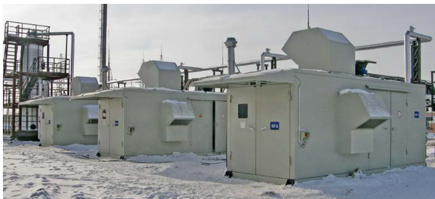
Фото 9. Газодожимное оборудование низкого давления на ДНС-2 НГДУ «Комсомольскнефть»

ния), особенно когда компрессорные станции эксплуатируются без резервной установки;