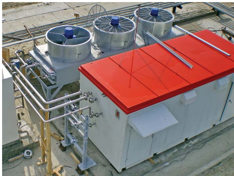
Фото 4. Адсорбционный осушитель для дополнительной осушки попутного газа на ЦПС Западно-Могутлорского месторождения ОАО «Аганнефтегазгеология»

газ на факелах, решен в России окончательно и бесповоротно. Сжигать ПНГ стало накладно. Однако срабатывают не только экономические санкции. Копоть от горящих факелов очерняет репутацию нефтяных компаний. Поэтому с каждым годом возрастает число промыслов, где не только эко-