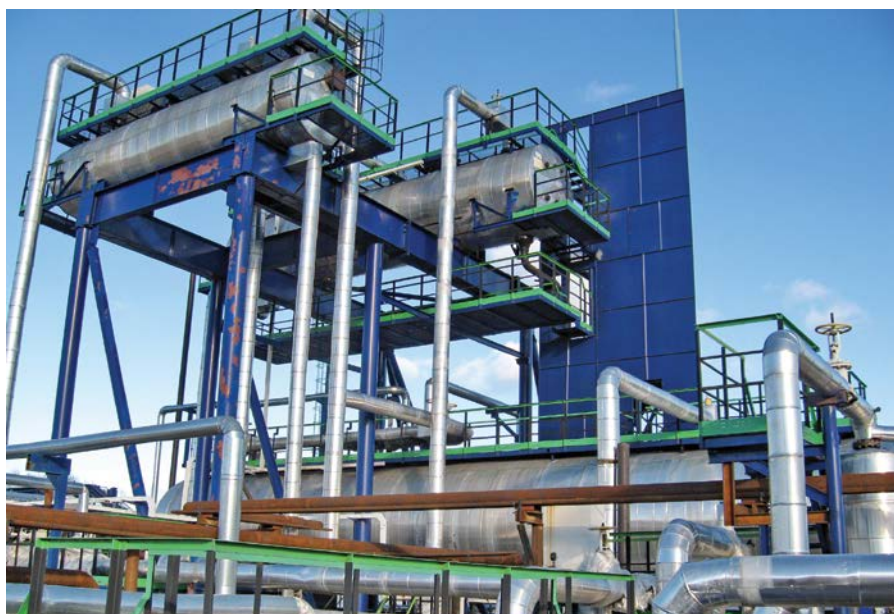
Фото 1. Разделительные сепараторы на установке подготовки нефти

Эффективность многоступенчатой сепарации особенно ощутима для месторождений легкой нефти с высокими газовыми факторами и давлениями на головках скважин. Регулируемые давление и температура создают условия для более полного отделения газа от нефти. Давление на сепараторе 1-й ступени всегда больше, чем на сепараторах 2-й и последующих ступеней. Показатели давления на ступенях се-