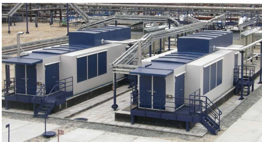
Фото 10. Вакуумные компрессорные установки «ЭНЕРГАЗ» работают на попутном газе с давлением 0,001 МПа

Жизнь убеждает: для рационального применения ПНГ в максимально возможных объемах потребуются целенаправленные усилия государства, общества и бизнеса, слаженная работа нефтяников, проектировщиков и производителей специального технологического оборудования.