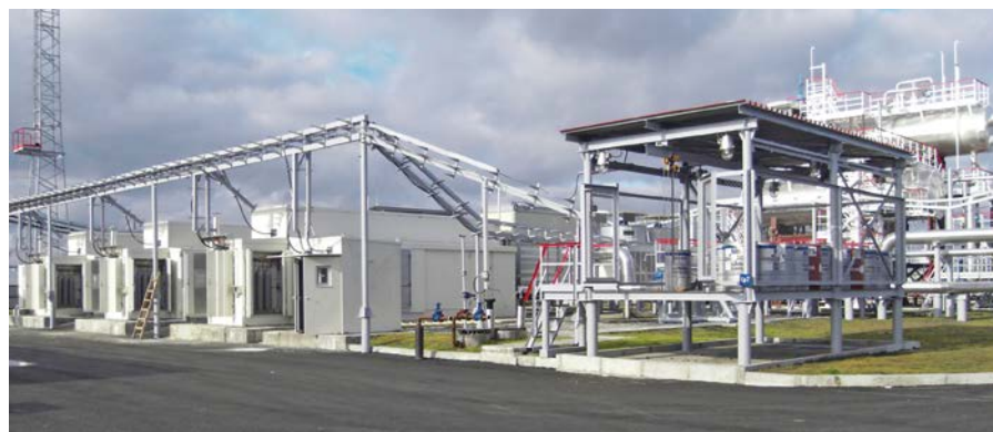
Фото 2. Битумское месторождение ОАО «Сургутнефтегаз». Компрессорная станция для компримирования низконапорного ПНГ

дания дополнительной инфраструктуры сбора и подготовки, что повышает себестоимость попутного газа и снижает рентабельность промыслов. Поэтому многие добывающие компании шли на затраты крайне неохотно, а