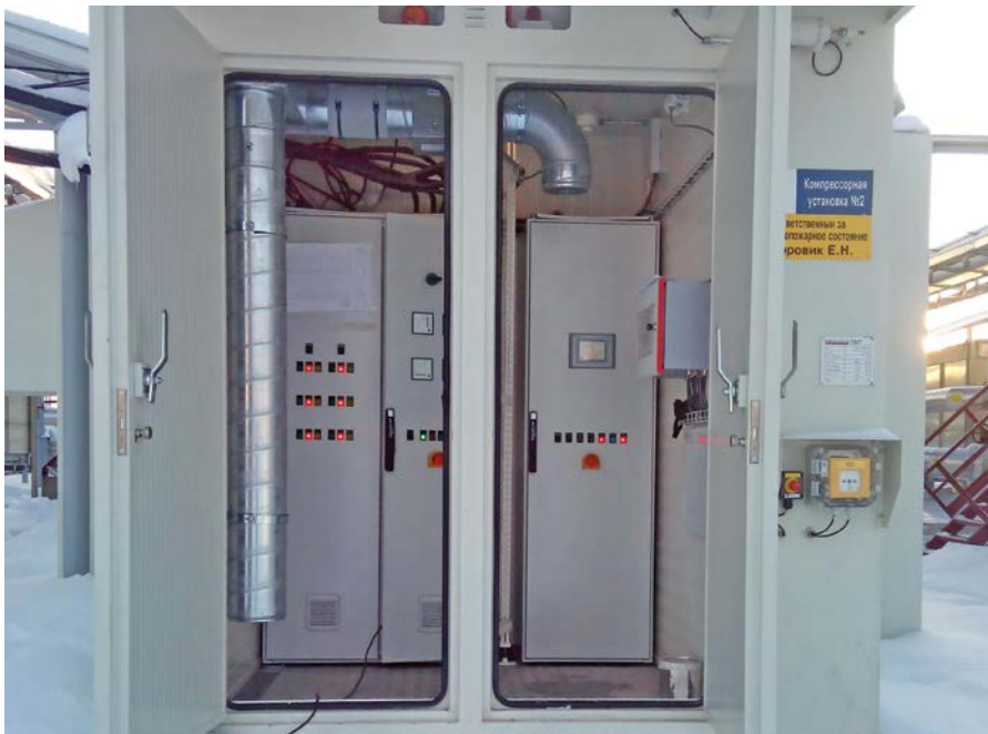
Фото 7. Отсек САУ компрессорной установки на КС Мурьянского месторождения

чего давление газа, имеющееся в установке, сбрасывается не только через сбросовую свечу, но и через входной трубопровод. При этом происходит унос масла из маслосистемы во входной фильтр-скруббер; 2) под действием вакуума в компрессорную установку может поступать воздух, что увеличивает взрывоопасность технологического процесса. Возможные решения: