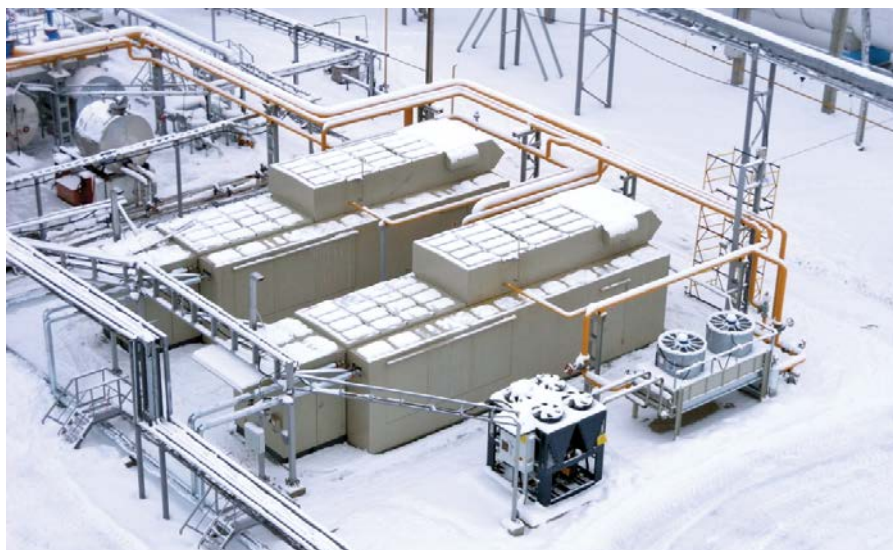
Фото 8. Компрессорная станция Речицкого месторождения («Белоруснефть») компримирует низконапорный ПНГ

Изменение характеристик исходного газа. По условиям некоторых проектов компрессорные установки компримируют смешанный попутный газ, поступающий с разных объектов добывающего комплекса. Соответственно, основные