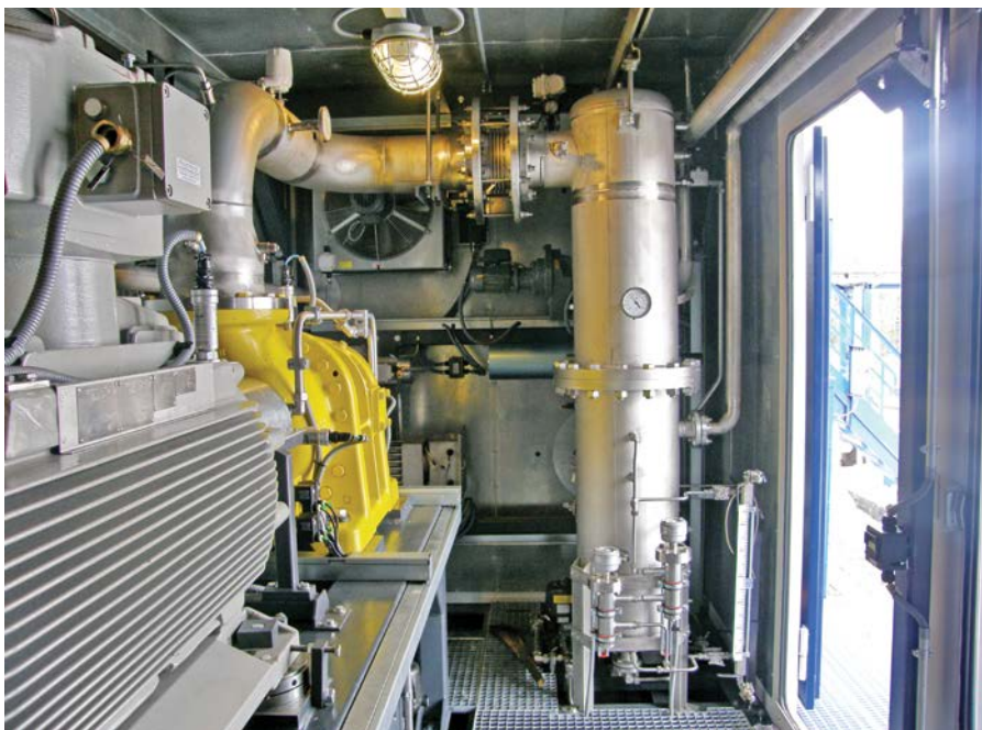
Фото 3. Фильтр-скруббер встроен в блок-модуль вакуумной компрессорной установки «ЭНЕРГАЗ» на ДНС-1 Вынгапуровского м/р ОАО «Газпромнефть-Ноябрьскнефтегаз»

зачастую вынужденно устранились от задачи рационального использования такого ПНГ.