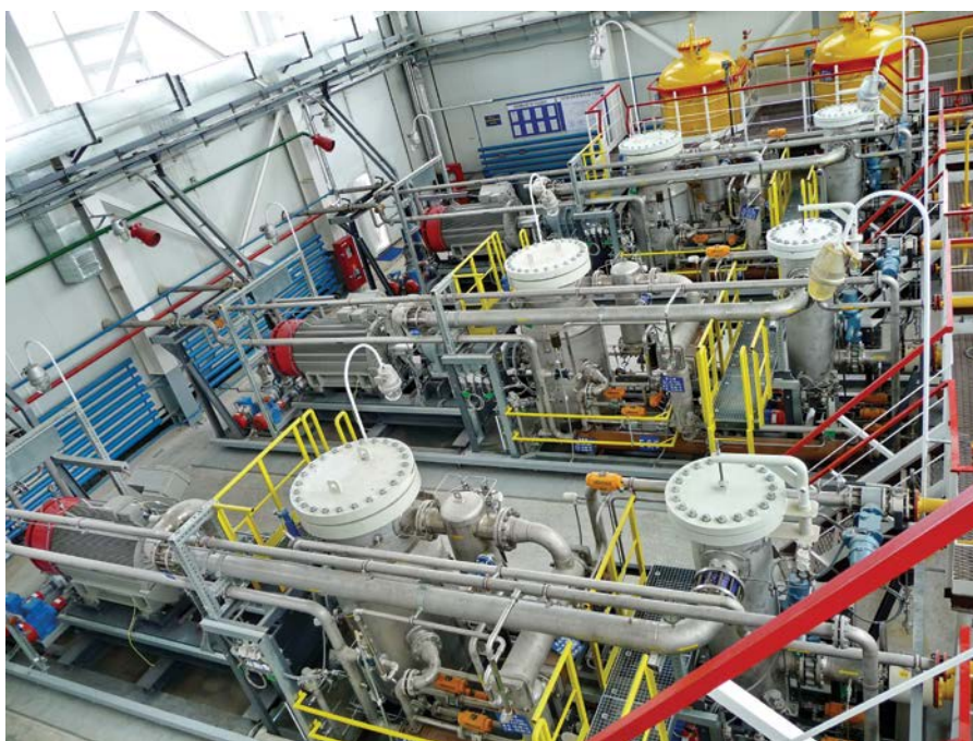
Фото 6. Дожимные компрессорные установки ангарного типа от компании «ЭНЕРГАЗ» снабжают попутным газом турбины ГТЭС Талаканского месторождения (Якутия)

Негативное влияние крайне низкого давления ПНГ, близкого к вакууму (0,001–0,01 МПа). Компримирование газа с давлением, близким к вакууму, влечет следующие проблемы: 1) возникает большая разница в давлении на входе и на выходе КУ, вследствие