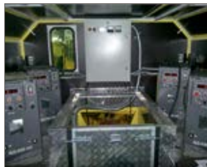
Рис. 3. Насыщение передвижного комплекса сварочных работ на базе трактора «Кировец» К-701