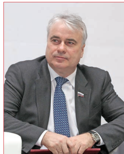
Фото 4. Председатель Комитета Госдумы по энергетике Павел Завальный