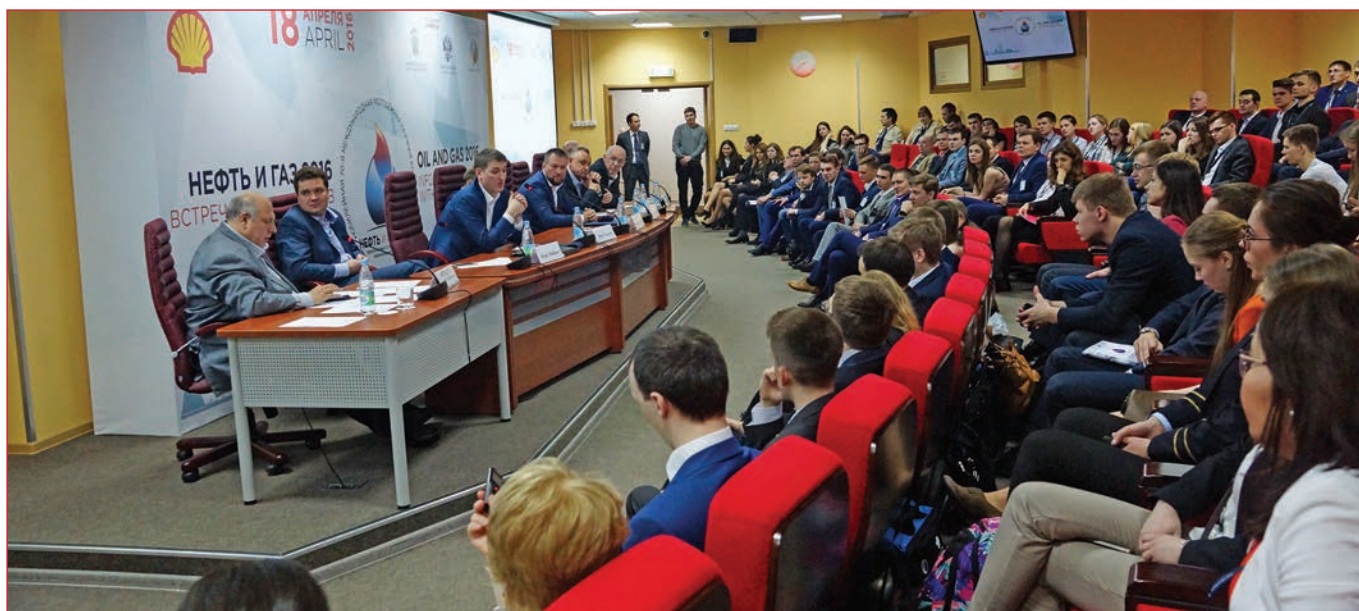
Фото 5. В рамках конференции впервые была проведена «встреча без галстуков»