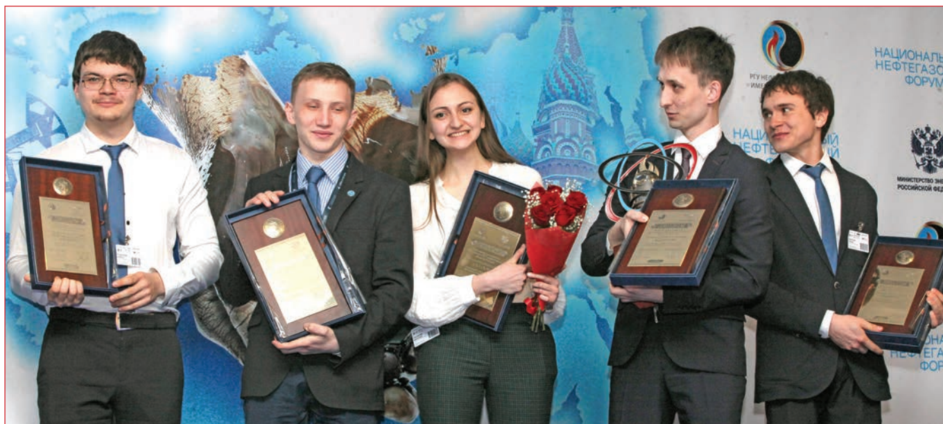
Фото 12. Награждение призеров, победителей конференции и конкурса состоялось 20 апреля на площадке III Национального нефтегазового форума

В завершение встречи с министром был положительно решен вопрос создания координационного мо-