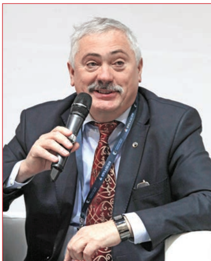
Фото 2. Ректор РГУ Виктор Мартынов