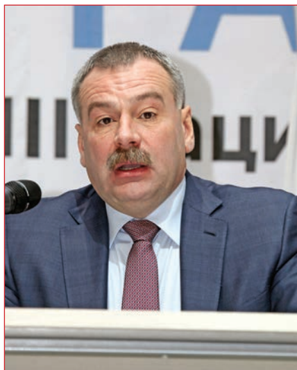
Фото 7. Директор департамента Министерства природных ресурсов и экологии РФ Антон Чернов