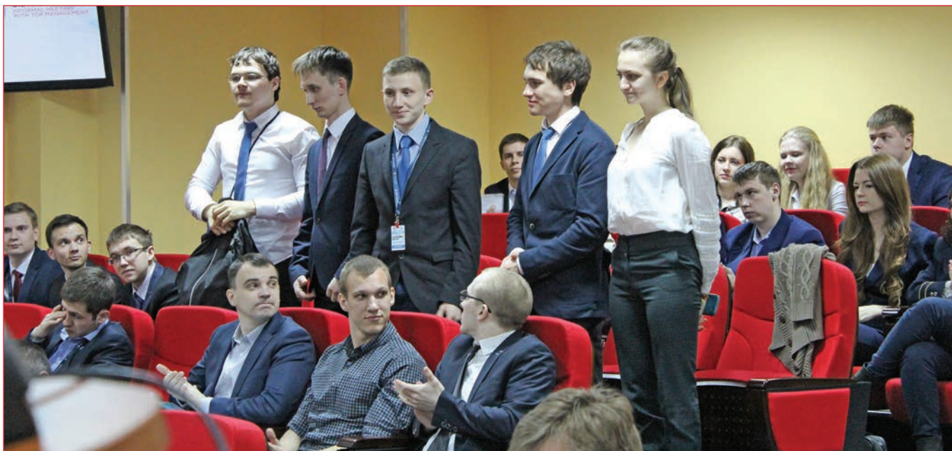
Фото 9. У участников конференции была возможность задать любой интересующий их вопрос руководителям нефтегазовых компаний и министерств