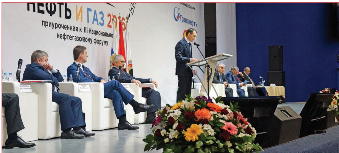
Фото 1. Президиум пленарного заседания 70-й Международной молодежной научной конференции «Нефть и газ – 2016»

18–20 апреля в РГУ нефти и газа (НИУ) имени И.М. Губкина прошла юбилейная, 70-я Международная молодежная научная конференция «Нефть и газ – 2016», приуроченная к III Национальному нефтегазовому форуму. В 2016 г. в конференции приняли участие более 1500 студентов, аспирантов, молодых ученых, специалистов, школьников из 213 образовательных учреждений и отраслевых организаций России и зарубежных стран. Конференция проходила при поддержке Министерства образования и науки РФ, Министерства энергетики РФ, Министерства природных ресурсов и экологии РФ, Торгово-промышленной палаты РФ, Российского газового общества.