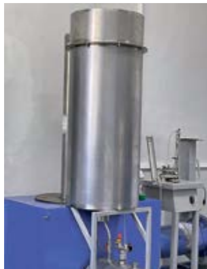
Стенд для проверки коалесцирующих фильтров