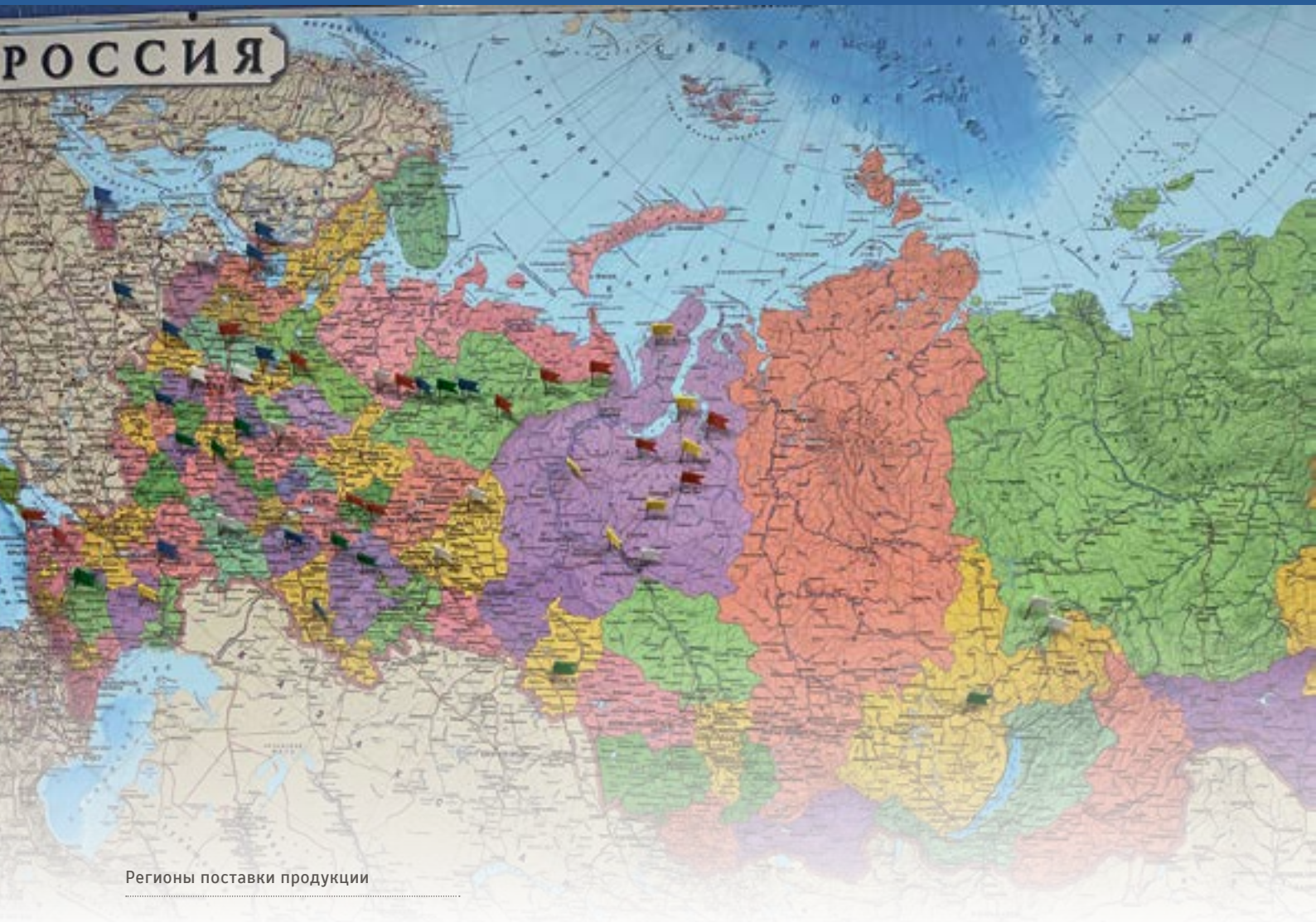
Регионы поставки продукции