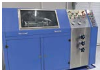
Стенд для испытания масляных фильтров

ООО «КРИПТОН» ДИНАМИЧНО РАЗВИВАЕТСЯ, РАСШИРЯЕТСЯ ПРОИЗВОДСТВЕННАЯ И ИСПЫТАТЕЛЬНАЯ БАЗА. КОМПАНИЯ ИМЕЕТ БОЛЬШОЙ ОПЫТ В ОБЛАСТИ ИМПОРТОЗАМЕЩЕНИЯ, ХАРАКТЕРИЗУЕТСЯ ВЫСОКИМ УРОВНЕМ РАЗРАБОТОК, ГАРАНТИРОВАННЫМ КАЧЕСТВОМ ПРОИЗВОДИМОЙ ПРОДУКЦИИ И РЕПУТАЦИЕЙ НАДЕЖНОГО ПОСТАВЩИКА. В НАСТОЯЩЕЕ ВРЕМЯ В СВЯЗИ С РЕЗКИМ РОСТОМ СПРОСА НА ИМПОРТОЗАМЕЩАЮЩУЮ ПРОДУКЦИЮ ПРЕДПРИЯТИЕ В МАКСИМАЛЬНО КОРОТКИЕ СРОКИ ПРОВОДИТ РАБОТЫ ПО СОЗДАНИЮ НОВЫХ ВИДОВ ПРОДУКЦИИ, НЕ УСТУПАЮЩЕЙ ПО ХАРАКТЕРИСТИКАМ ИЗДЕЛИЯМ ИМПОРТНОГО ПРОИЗВОДСТВА.