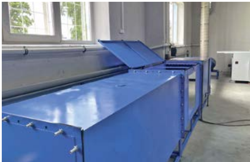
Стенд для испытания воздушных фильтров и фильтрующих материалов