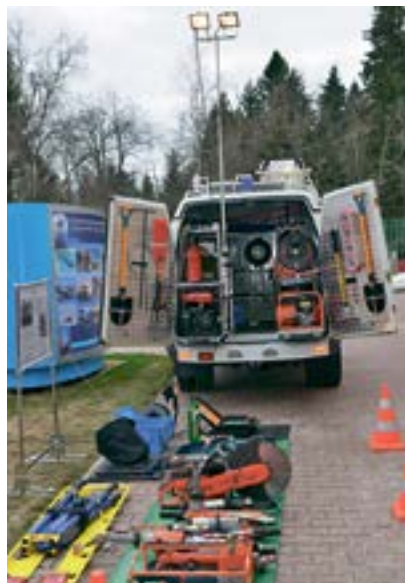
Рис. 2. Элементы учебно-материальной базы

Важной задачей, возложенной на образовательное учреждение, стала аттестация спасателей и аварийно-спасательных формирований. Она осуществляется объектовой комиссией Минэнерго России по аттестации аварийно-спасательных формиро-