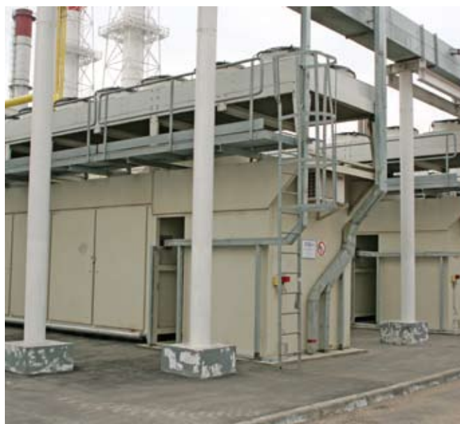
Фото 1. Блочное исполнение станции позволило разместить оборудование на крайне ограниченной территории