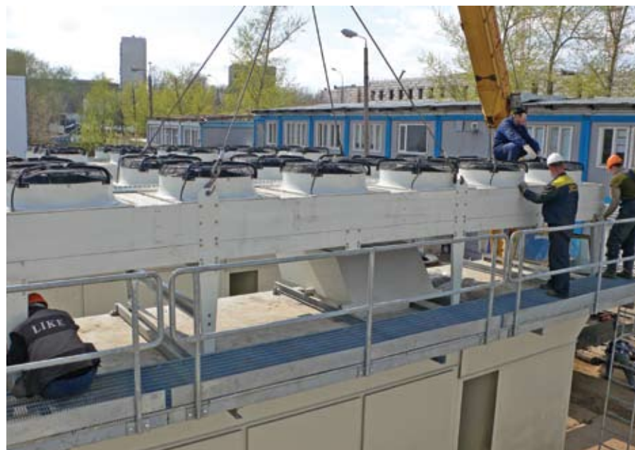
Фото 2. Монтаж дожимной компрессорной станции на ПГУ-ТЭС «Москва-Сити»

По окончании гарантии на оборудование между компанией «ЭНЕРГАЗ» и ТЭС «Международная» был заключен контракт на осуществление постгарантийного технического обслуживания. В настоящее время специалисты московского представительства компании выполняют весь спектр необходимых работ.