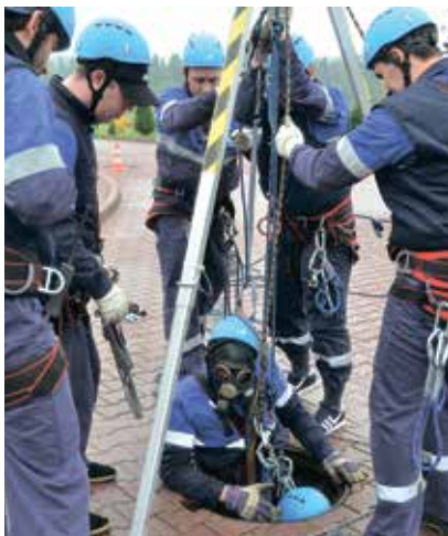
Рис. 2. Отработка навыков и умений ведения поисково-спасательных работ

эффективная с точки зрения экономии денежных средств дочерних обществ и организаций ПАО «Газпром». За 2016 г. с применением выездной формы обучения подготовлено свыше 900 человек. С 2015 г. успешно развивается дистанционная форма обучения. За 2016 г. с применением дистанционной формы обучения подготовлено более 1 тыс. слушателей, а на 2017 г. запланировано обучение свыше 1,5 тыс. работников.