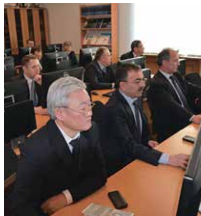
Рис. 3. Подготовка руководителей постоянно действующих органов управления систем гражданской защиты дочерних обществ

Подготовка работников проходит в тесном взаимодействии с